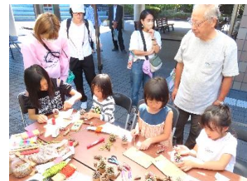
私たちの出展ブース

「オフィス SKG」は、今年度から5年間「堺公園墓地・霊堂・霊堂」の指定管理者となった企業で、今年から「このようなイベント」を仕掛けられたものです。